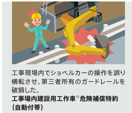
工事現場内でショベルカーの操作を誤り横転させ、第三者所有のガードレールを破損した。 工事場内建設用工作車※危険補償特約(自動付帯)