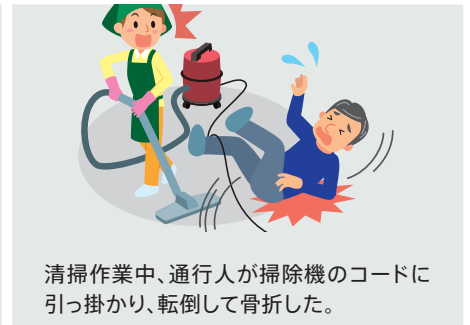
清掃作業中、通行人が掃除機のコードに引っ掛かり、転倒して骨折した。