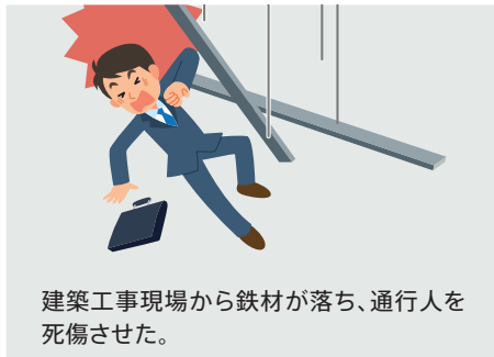
建築工事現場から鉄材が落ち、通行人を死傷させた。