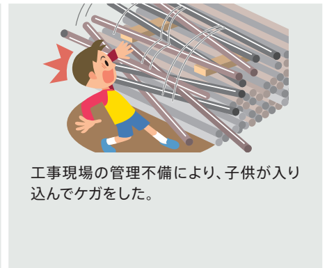
工事現場の管理不備により、子供が入り込んでケガをした。